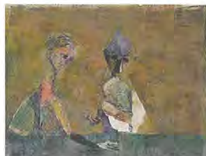
《二人》 1960(昭和35)年 油彩、コラージュ・紙 31.0×41.0cm