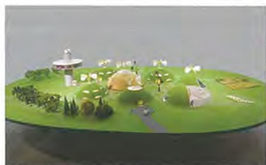
《呼吸する大地(ジオラマ)》 2009(平成21)年 ミクストメディア 243.0×354.0×高さ109.0cm