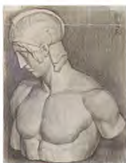
《マルス》 1956(昭和31)年 木炭・紙 65.0×50.0cm