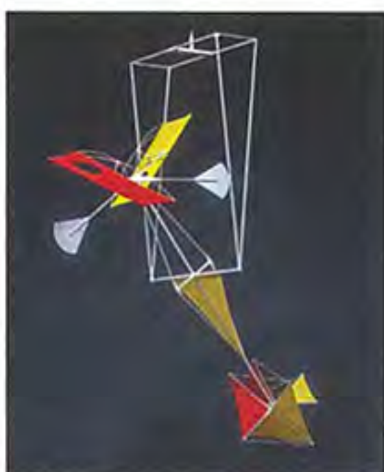
《時の流れ》2013(平成25)年 ステンレス、アルミニウム、カーボンファイバー、 ポリエステル布 径146.0×高さ143.0cm