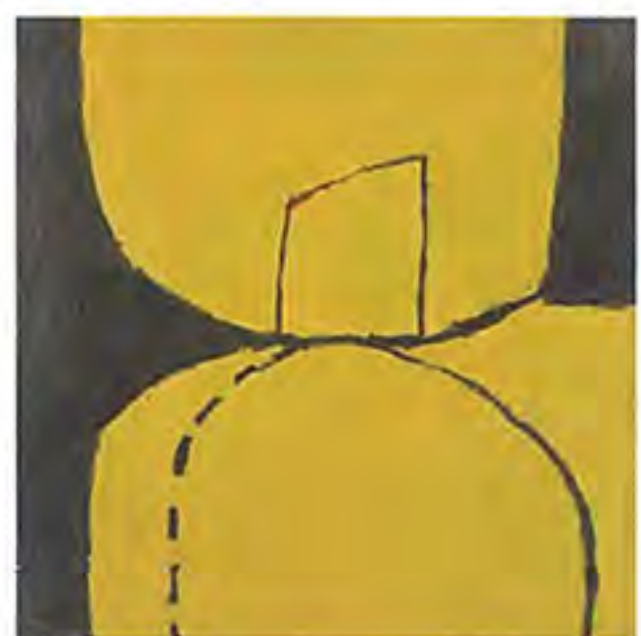
《フォルマ》 1964(昭和39)年 油彩・キャンバス 80.0×80.0cm