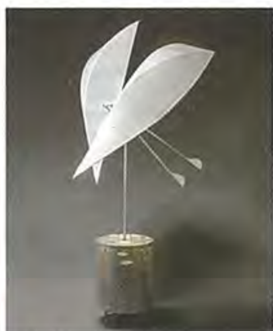
《月の舟》2009(平成21)年 ステンレス、アルミニウム、カーボンファイバー、 ポリエステル布 径126.0×高さ191.0cm