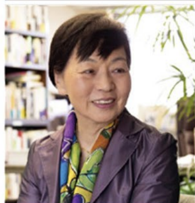
JT生命誌研究館館長・理学博士