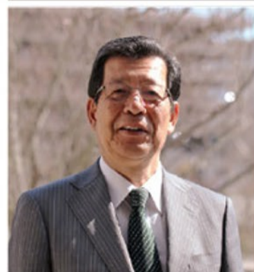
兵庫県立人と自然の博物館館長