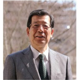
兵庫県立人と自然の博物館館長