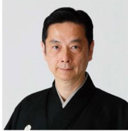
能楽小鼓方大倉流十六世宗家・人間国宝